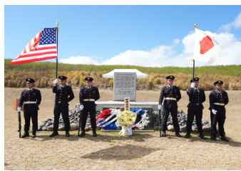
日米両国旗を奉持する旗衛隊

硫黄島において3月28日、日米合同戦没者追悼慰霊式が厳粛に執り行われ、師団から第34普通科連隊が参加した。これまで同式では日米双方の旗が、本年は米海兵隊員による旗衛隊が参加し、それぞれ国旗を奉持していたが、本年は米海兵隊員による旗衛隊が参加し、それぞれ国旗を奉持していた。これまでも同式では日米双方の旗が、本年は米海兵隊員による旗衛隊が参加し、それぞれ国旗を奉持していた。これまでも同式では日米双方の旗が、本年は米海兵隊員による旗衛隊が参加し、それぞれ国旗を奉持していた。