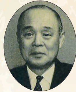
初代会長 櫻田 武 (日経連会長) S41年～ S53年