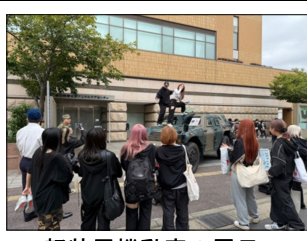
軽装甲機動車の展示

本年度、足立地域事務所が担当する帝京科学大学の学生との接点を発端として、学園祭実行委員との交流につなげ、同大学の学園祭（桜科祭）へ募集広報ブースを出展することができたことをモデルケースとし、今年度は担当地域内の他の大学の学園祭にも募集広報ブースを出展しようという目標を立て、担当地域の大学生に対して部隊見学やヘリの体験搭乗などのイベントを活用しつつ関係を構築し、東京電機大学及び文教大学の学園祭への参加を達成することができた。