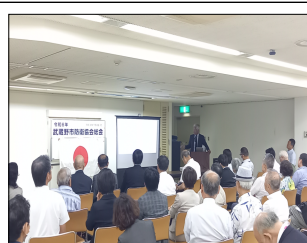
防衛講演会の様子

当日は収容人数1,000名の日野市民会館大ホールがほぼ満席となり、航空中央音楽隊の素晴らしい演奏も相まって、皆様には十分楽しんで頂けたかと思えます。また、本公演は能登半島地