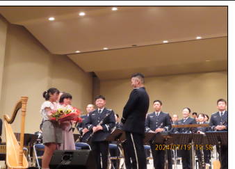
コンサート後の花束贈呈

「来場の皆様、東京都防衛協会をはじめとするご後援を頂きました各団体様、ご協賛を賜りました市内外の各企業様、団体に厚く御礼申し上げます。